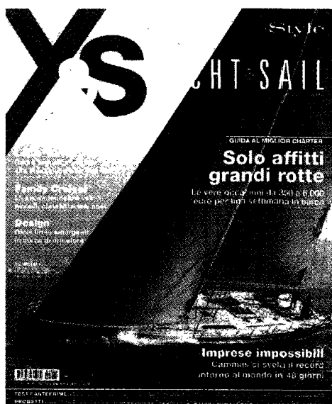
La copertina e alcune pagine del numero di maggio di Yacht&Sail in edicola